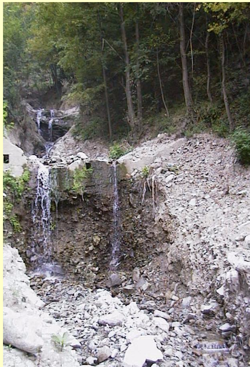
Ardenno (So) novembre 1998