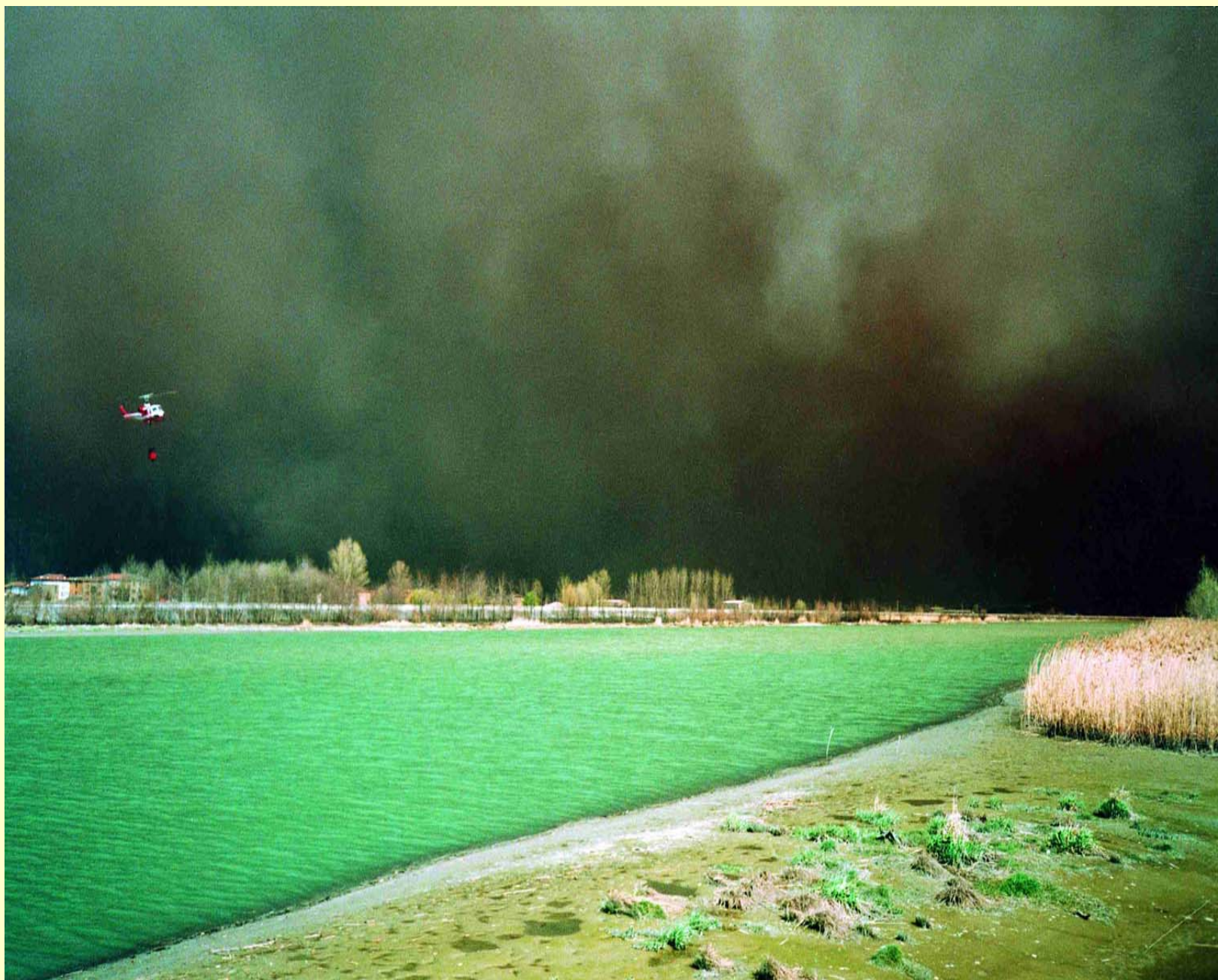
Ardenno (So) 1998 visto da Sondrio