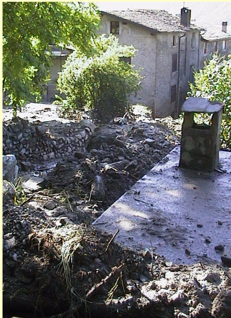
Ardenno (So) novembre 1998