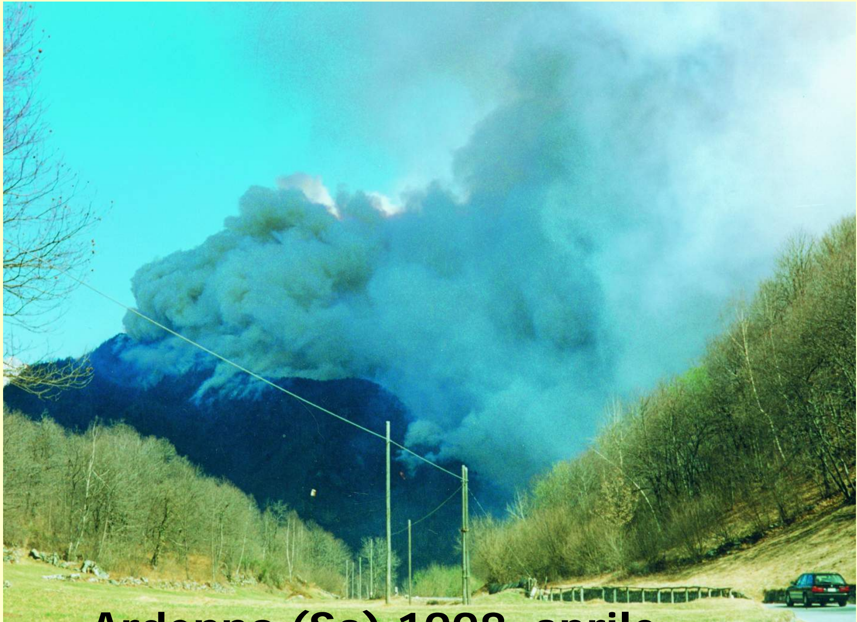
Ardenno (So) 1998 aprile